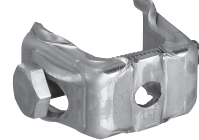
KSバグリップ直交型